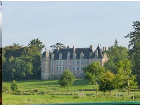
La façade nord (vue éloignée)