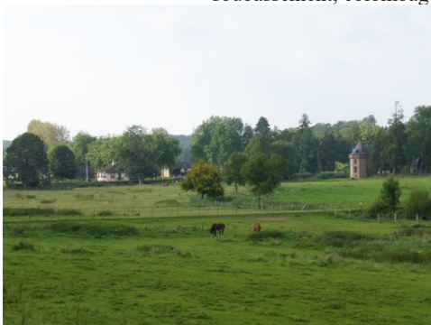
La vue sur le domaine et la campagne

Les avis seront cohérents avec ceux émis ces dernières années, à savoir : pas de maisons à volume compliqué (type V, W, Y, ou Z), pentes à 45° pour les volumes principaux, ardoise ou tuile plate de teinte brun vieilli, à 20u/m 2 , avec un débord de toiture de 20cm, enduit de teinte beige clair avec modénatures (au choix : chaînages, encadrement de fenêtres, soubassement, colombage...). *Voir les autres fiches.