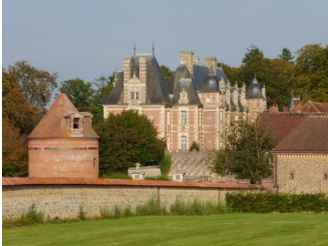
Le colombier, le château vus de l'Ouest