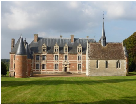
La façade sud du château et la chapelle