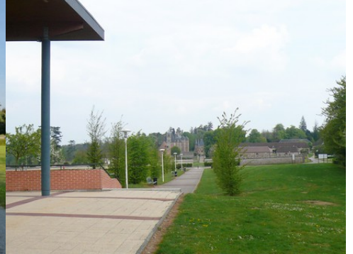
Le château vu du lycée agricole

Pour la zone en rose foncé dans le périmètre de 500m