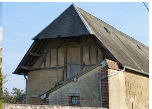
Une façade à pans de bois et bauge