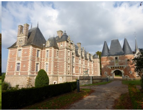
La poterne d'entrée depuis l'Ouest