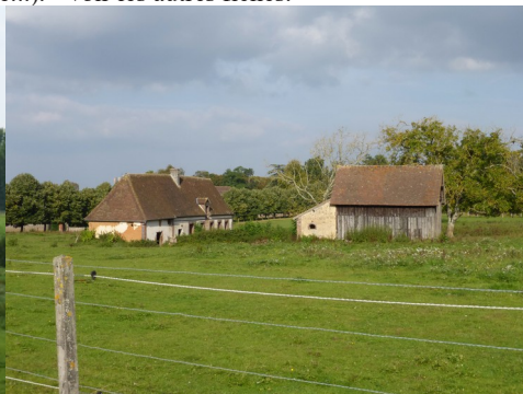
Le paysage rural avoisinant