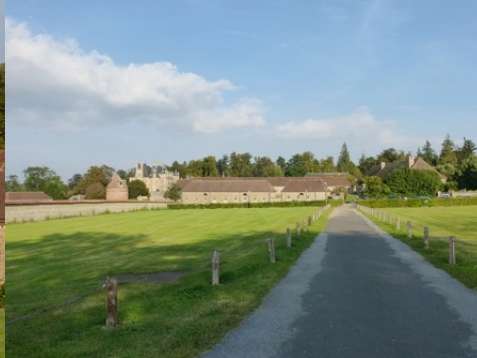
L'accès aux communs depuis l'Ouest