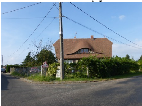
Quelques maisons de Gouville