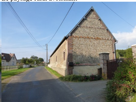
Un pignon en briques et en moellons